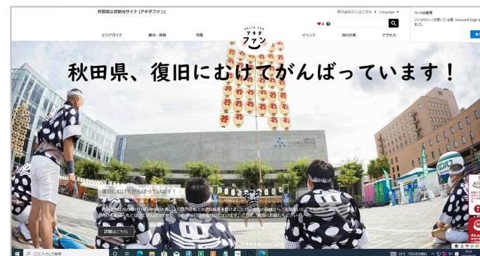
ウェブサイトによる周知

秋田県公式観光サイト「アキタファン」やSNS等において、交通機関の運行再開や行事の実施予定などの情報を周知しているほか、業界団体等に対し、同様の情報発信を依頼している。