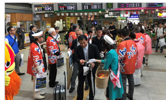
秋田駅中央改札口前PR（イメージ）